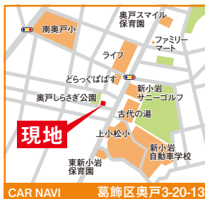
CAR NAVI 葛飾区奥戸3-20-13

東新小岩保育園…徒歩2分 ライフ ……徒歩2分 南奥戸小学校…徒歩5分 どちらくばばす…徒歩2分 上平井中学校…徒歩7分 ファミリーマート…徒歩4分