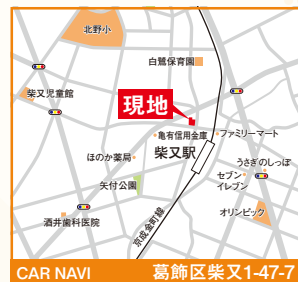
CAR NAVI 葛飾区柴又1-47-7

■専有/51.71㎡■バルコニー/6.48㎡間取/2LDK (H5年3月築) ■構造/RC造(7階建の4階部分) ■管理費/19,100円/月 ■修繕積立金/16,080円/月 ■管理/全部委託(日勤) ■引渡日/R6年6月上旬 ■所在/葛飾区柴又1丁目47-7 (専任媒介)