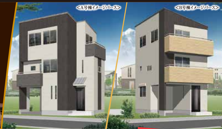
<A号棟イメージバス>